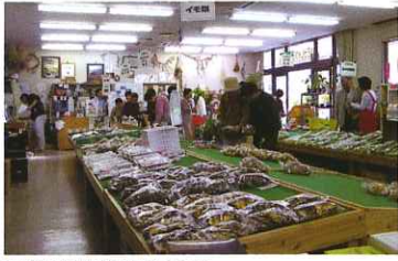
両神農林産物直売所