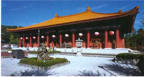
埼玉県山西省友好記念館 神怡館(しんいかん)