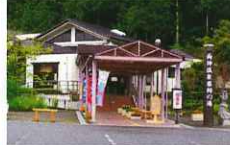
道の駅 両神温泉 薬師の湯