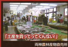
「土産を買ってってくんない!!」

素朴で人にあっかい、そんな見どころいっぱい的小鹿野町両神です。ぜひ、みなさんで「寄ってってくんない!!」