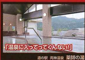
「温泉に入ってってくんない!!」