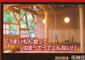
「うまいもん食って泊まってってくんない!!」