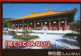
「見てってくんない!!」