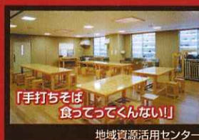
「手打ちそば食ってってくんない!!」